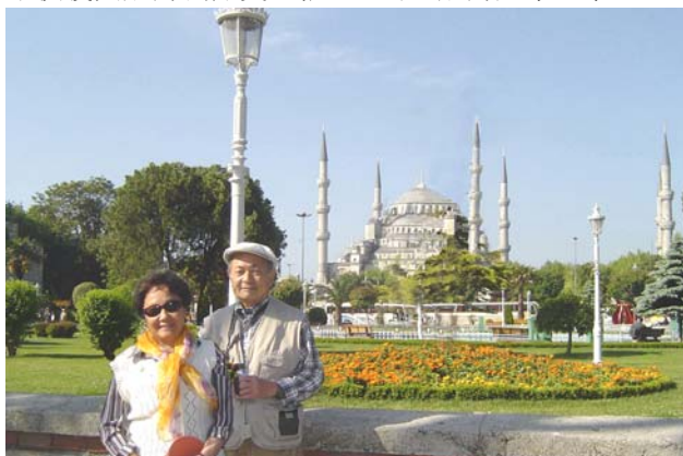
作者夫妇摄于蓝色清真寺前。

伊斯坦布尔是土耳其最大的城市、最大的工商业中心和主要的旅游胜地。全市面积 254 平方公里，人口大约 1180 万，98%的居民信奉伊斯兰教。现在市区包括海峡中、南段两岸以及与之相连的马尔马拉海北岸地段。伊斯坦布尔之所以闻名于世，主要原因之一是其得天独厚的地理位置。在亚洲大陆最西端的黑海与地中海之间，有一条至关重要的“黄金水道”，它把亚洲和欧洲大陆分割开来，其中间部分是马尔马拉海，南端叫达达尼尔海峡，北端叫博斯普鲁斯海峡，总称黑海海峡。此“黄金水道”是黑海通向外界的咽喉要地，伊斯坦布尔就坐落在博斯普鲁斯海峡两岸。从这里出发向北从海上直达黑海沿岸各国；向南通向地中海，从海上可通欧、亚、非三个大陆；站在伊斯坦布尔的高处向西望去，欧洲大陆近在咫尺；向东是通往中国丝绸之路的一段组成部分，这种优越的地理位置，不仅使其成为洲际交通枢纽，而且成为兵家必争之地。